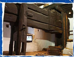
MUSEO ETNOGRÁFICO. BENALAUURÍA